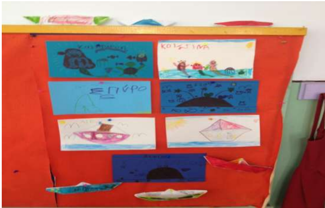
Διαβάσαμε βιβλία και παραμύθια για το καλοκαίρι και τη θάλασσα.